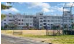
桜丘中学校 徒歩16~18分 (約1,240m~1,390m)