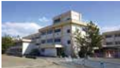
桜丘小学校 徒歩16~18分 (約1,240m~1,390m)