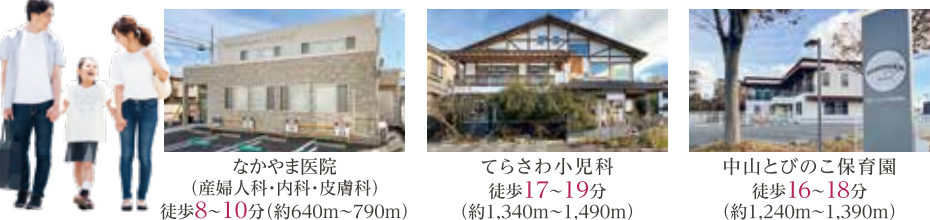
なかやま医院 (産婦人科・内科・皮膚科) 徒歩8~10分(約640m~790m)