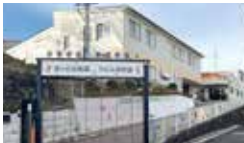
泉ヶ丘幼稚園・アルル保育園 徒歩8~10分 (約640m~790m)